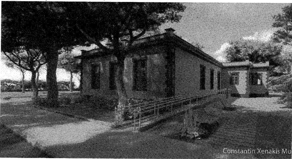
Constantin Xenakis Mu